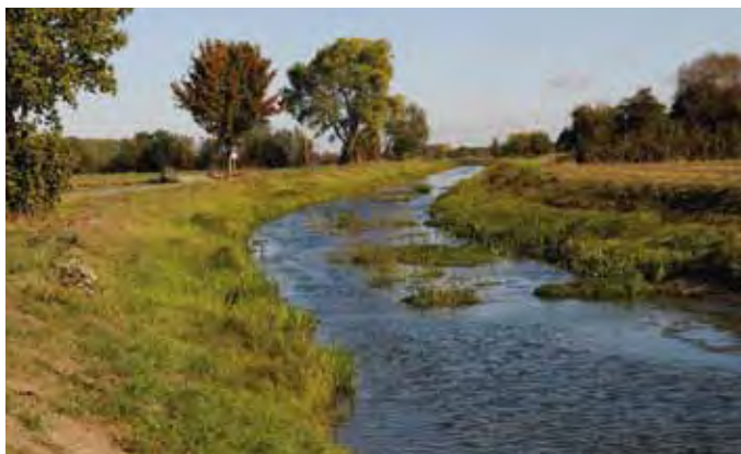
An der Eyter

Durch den Friedensvertrag von Celle 1679/81 wurden Emtinghausen und Bahlum zusammen mit den übrigen Ortschaften des Amtes Thedinghausen braunschweigisch.