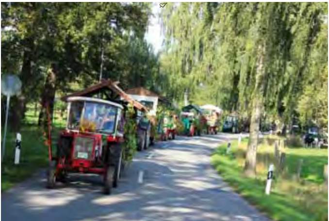
Bunt geschmückte Festwagen beim Erntefest